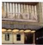
di per ora restano chiuse