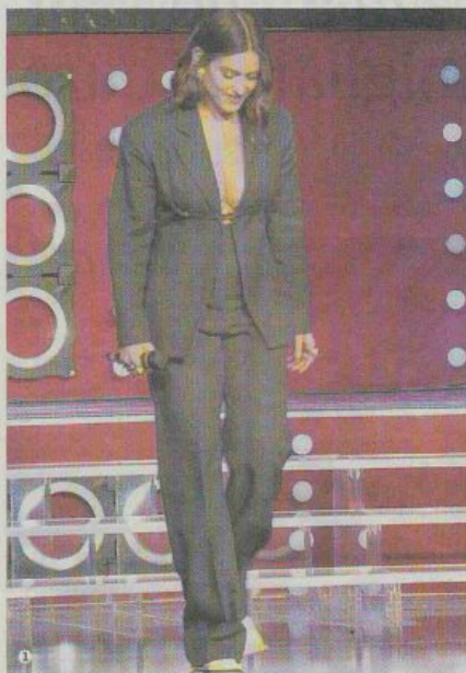
1. Gaia, un volto e una voce che saranno protagonisti del Festival, è stata tra i primi Big dell'edizione 2021 ad essere stati presentati da Amadeus 2. Il biglietto, postato su Instagram, che il sindaco a nome della città ha inviato al presentatore e alla moglie Giovanna 3. Francesco Renga ieri sera a Sanremo Giovani