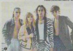
1. Amadeus, per il secondo anno direttore artistico e presentatore del Festival. 2. Il ritorno di Arisa. 3. Renga. 4. Prima volta a Sanremo per Fedez in coppia con Francesca Michielin. 5. Noemi. 6. Max Gazzè. 7. I Maneskin, gruppo arrivato al successo nel 2017 grazie a X Factor. 8. Madame, rapper vicentina in grande ascesa.

Aiello Annalisa Arisa Malika Ayane Orietta Berti Bugo Colapesce/Di Martino Coma Cose Gio Evan Extraliscio + Feat Fasma Fulminacci Gaia Ghemon Irama La rappresentante di Lista Lo Stato Sociale Madame Maneskin Ermal Meta Max Gazzè Fedez/Michiellin Noemi Willie Peyote Random Francesco Renga