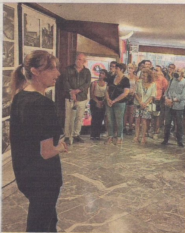
La visita svela tutti i segreti del teatro del Festival

A Sanremo per cinque giorni alla settimana, dal martedì al sabato, si può visitare il teatro Ariston. L'apertura della cassa per l'Ariston Tour è prevista alle 9.30, le partenze alle 10, 11.15 e 19.15 dalla hall. I visitatori potranno effettuare un percorso guidato dietro le quinte e nella storia del teatro. Le pareti, le colonne e i soffitti dell'edificio ospitano oggetti d'arte. All'interno ci sono gigantografie di grandi personaggi come Pippo Baudo, Celentano, un giovanissimo Fabio Fazio con Laetitia Casta e le immagini del Premio Tenco. Il costo del biglietto è di 9 euro, ridotti 6 euro per bambini dai 6 ai 12 anni, la durata è di un'ora. — A. B.