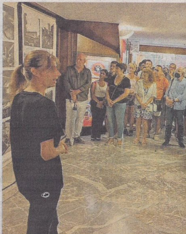
La visita svela tutti i segreti del teatro del Festival

A Sanremo per cinque giorni alla settimana, dal martedì al sabato, si può visitare il teatro Ariston. L'apertura della cassa per l'Ariston Tour è prevista alle 9.30, le partenze alle 10, 11.15 e 19.15 dalla hall. I visitatori potranno effettuare un percorso guidato dietro le quinte e nella storia del teatro. Le pareti, le colonne e i soffitti dell'edificio ospitano oggetti d'arte. All'interno ci sono gigantografie di grandi personaggi come Pippo Baudo, Celentano, un giovanissimo Fabio Fazio con Laetitia Casta e le immagini del Premio Tenco. Il costo del biglietto è di 9 euro, ridotti 6 euro per bambini dai 6 ai 12 anni, la durata è di un'ora. — A. B.