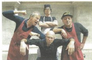
I pirati dei caruggi

tra numerosi applausi degli spettatori. Il tour comprende Genova, Roma, Barcellona e il Festival del Circo di Montecarlo.