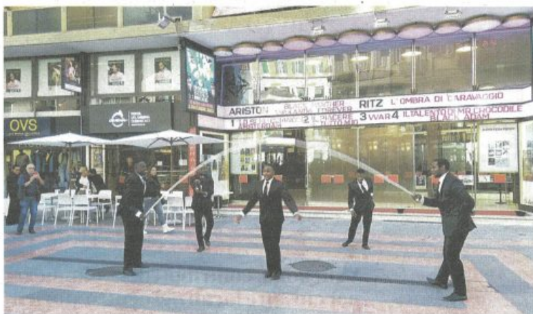
L'esibizione del gruppo The Black Blues Brothers ieri davanti all'Ariston

"The black Blues Brothers" è stato presentato davanti alla gente che in quel momento passeggiava in via Matteotti, sono usciti dal teatro Ariston dando un'anteprima di quello che si potrà vedere nella serata del 2 dicembre, con spettacolari evoluzioni circensi,